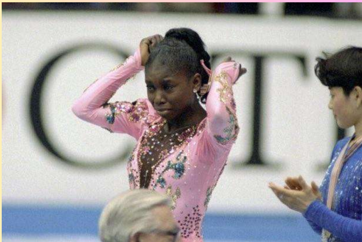
Surya Bonaly qui enlève sa médaille d'argent au championnat du monde en 1994

Athlète et artiste au parcours atypique, Surya Bonaly, bien que 9 fois championne de France, n'a jamais décroché le titre olympique. Jugée trop musclée pour être gracieuse et sûrement trop noire pour être médaille d'or, Surya Bonaly ne s'est jamais pliée aux normes de la discipline et brille par sa différence. Cette Femme est une figure inspirante et son histoire soulève des questions à la fois actuelles et universelles.