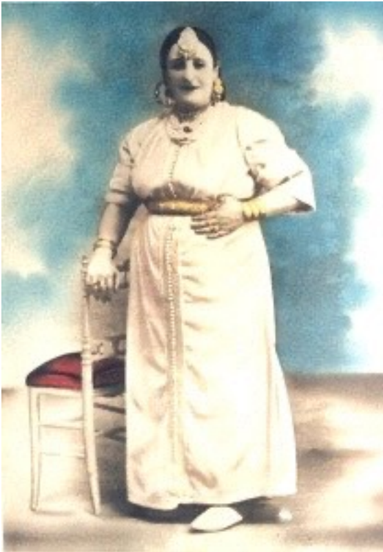
Portrait de Zohra El Fassia , chanteuse marocaine

Les cheikhas, pollinisatrices de la Méditerranée.