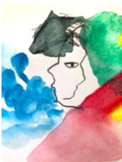
Dessins Bérengère Vallet pour le projet.

Projection vagabonde Les films et les dessins animés seront projetés sur le plateau dans le cadre d'un spectacle vivant, avec de la musique live, composée sur mesure. Pas d'écran principal mais différentes surfaces-écrans qui apparaîtront à divers endroits de la scène, sans que l'on y attende ; une symphonie de voix, de visages qui émanent de la scène sur des écrans de fortune ; linges, tissus, un mur blanc derrière le public. Des expériences empiriques de nos personnages documentaires naissent des émotions puis un roman personnel entre fantasma et réel. Les musiciens prendront part aux récits, les commenteront, activeront des projections. Par ailleurs des cheikhas apparaîtront dans la scénographie du spectacle sous forme de totems. Elles habiteront le plateau comme des gardiennes de la parole des enfants. Une caution sacrée nous rappelant sans cesse que nous sommes au Théâtre et non dans la « vraie vie ». C'est tout juste entre documentaire et fiction que s'inscrira ce nouveau ciné concert jeune public entre deux pays, deux continents, une méditerranée.