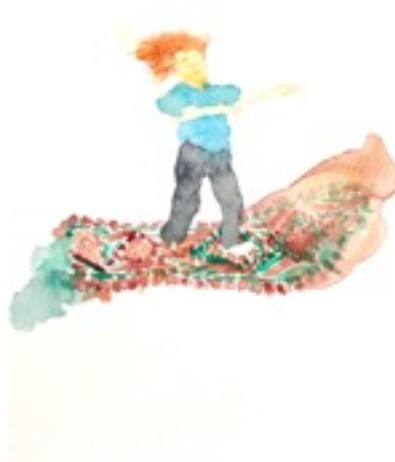
Dessin Bérengère Vallet