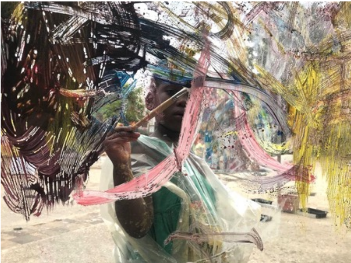
Projet de peinture collective Fenêtre dans la ville de Bérengère Vallet et crédit photo.

Nous souhaitons sortir du portrait américain traditionnel pour aller vers une forme d'abstraction, en réponse aux dessins d'enfants qui souvent surprennent par leurs fantaisie, leur liberté, leur profondeur, les émotions qu'ils suscitent. Par ailleurs, ce sont plusieurs histoires en une que nous dessinerons. Noir et blanc ou couleurs ? la question reste ouverte. Gros plans sur les parties du corps, une main qui trace une ligne nous conduit à un regard à l'horizon. Les dessins parlent et chantent. Les corps bougent et se livrent. La pluralité des témoignages doivent nous conduire à un seul récit telles les pièces d'un puzzle qui ne cesse de se mouvoir. Le film aura la volonté d'incarner une fusion des corps à l'instar de la France et de la Tunisie, terres de migrations constantes.