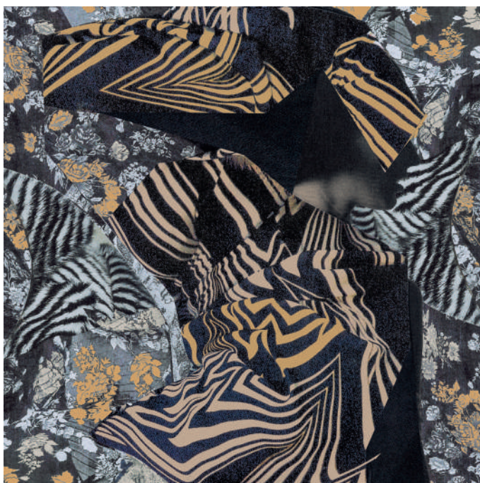
Hélène, 2024 © Peter Knapp / galerie baudoin lebon