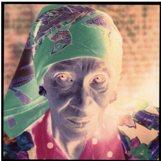
Marthe Carnet de baal, 1996 © Peter Knapp / galerie baudoin lebon