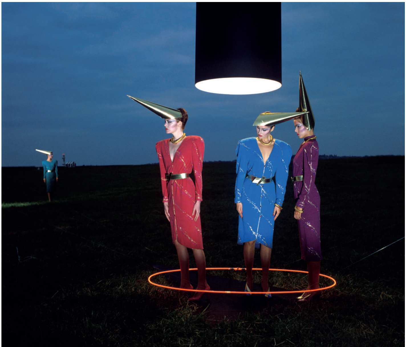
Collection Montana, 1978