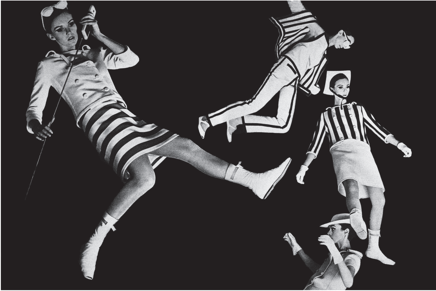
Courrèges, 1965