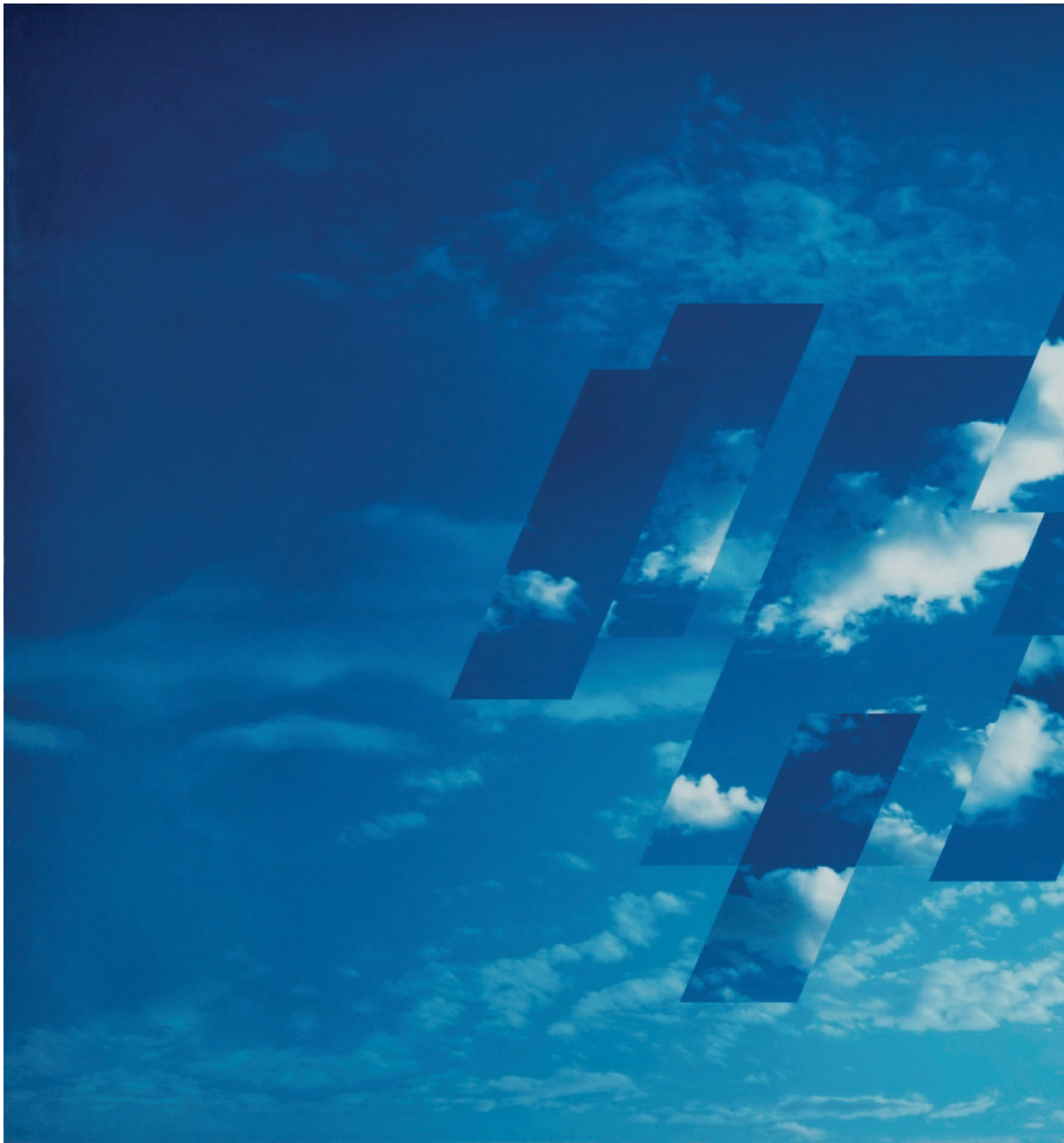
Quatrième dimension, 1980 © Peter Knapp / galerie baudoin lebon