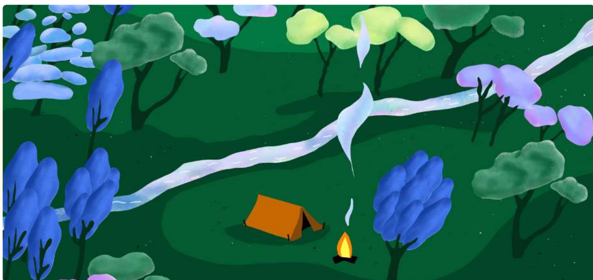
Dessins réalisés par Tiffanie pour DOGGO